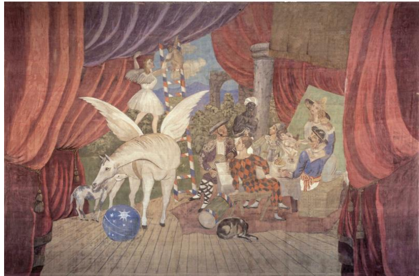
©Parade, Pablo Picasso, 1917

Le rideau de scène de Parade représente un véritable défi de conservation et d'exposition. Gigantesque toile de jute peinte à la main, de plus de 10 mètres sur 16 , fragile et difficile à suspendre, sa survie nécessite une campagne de restauration qui s'appuie sur une technique innovante conçue par une équipe d'ingénierie. PERRIER® s'inscrit en soutien au développement de cette connaissance de pointe dans la perspective d' accompagner la conservation de cette pièce iconique sur le temps long , pour les générations présentes et futures.